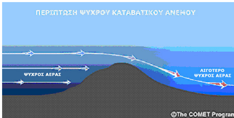
Σχήμα 2. Σχηματισμός ψυχρού καταβατικού ανέμου τύπου bora.

foehn, η αέρια μάζα που συναντά τον ορεινό όγκο είναι τόσο ψυχρή, ώστε ο αέρας που φτάνει στην επιφάνεια του εδάφους συνεχίζει να είναι ψυχρός, παρά τη θέρμανση που υφίσταται, κατά την καθοδική του κίνηση.